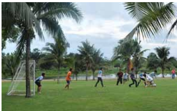
การแข่งขันฟุตบอล

เหตุการณ์เล็กๆ น้อยๆ ที่ผ่านสายตาของผมนี้ แม้จะเป็นเพียงเสี้ยวเล็กๆ ของสิ่งที่เกิดขึ้นทั้งหมด แต่ก็มีความประทับใจที่อยากจะสัมผัสและเชื่อว่าบางเรื่องน่าจะเป็นประโยชน์ต่อคุณผู้อ่านครับ :-)