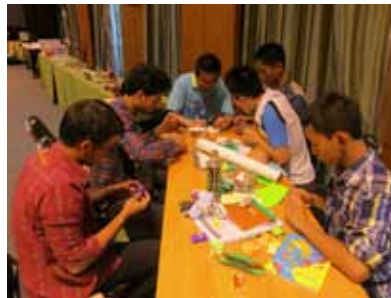
เยาวชนในค่ายกำลังเรียนกับ ปอม-นักพับกระดาษ