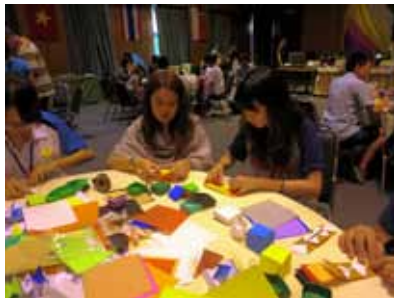
เยาวชนและพี่เลี้ยงกำลังพับกล่อง 4 มิติ

ในช่วงบ่าย ซึ่งแต่ละคนมีอิสระในการพับสิ่งที่ตนเองสนใจ ผมก็มีโอกาสพูดคุยกับเขาชวนจากหลายชาติ เช่น พม่า จีน เกาหลี กัมพูชา และเวียดนาม ทำให้คุ้นเคยกันและได้เรียนรู้เรื่องเล็กๆ สนุกๆ มานิดหน่อย