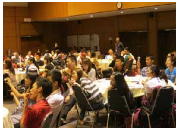
เยาวชนกำลังสนใจคลิปซึ่งแสดงให้เห็นว่าโมเดลกระดาษพับสามารถพลิกแพลงได้หลากหลาย

โมเดลกระดาษพับมีตั้งแต่ของเล่นสนุกๆ เช่น ปากจุกๆ นกกระพือปีก และสุนัขขยับหัวได้ โมเดลแสดงขั้นตอนการพับ เช่น เบ็ดน้อย ด้วงคีม และปู โมเดลแสดงรูปทรงทางคณิตศาสตร์ที่เปลี่ยนรูปร่างได้ เรียกว่า ไฮพาร์ (hyper) ซึ่งย่อมาจาก ไฮเพอร์โบลิก พาราโบลอยด์ (hyperbolic paraboloid) ส่วนโมเดลที่ซับซ้อนที่สุด คือ โครงกระดูกไดโนเสาร์ แบรคคิโอซอรัสซึ่งเป็นผลงานการพับของยอดฝีมือจากชมรมนักพับกระดาษไทย