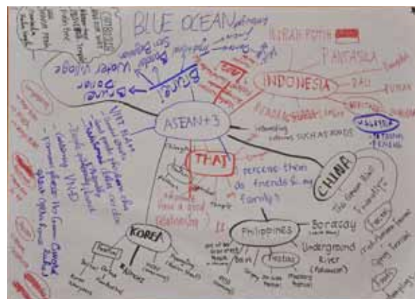
ภาพลักษณ์ของแต่ละประเทศในมุมมองของกลุ่ม Blue Ocean