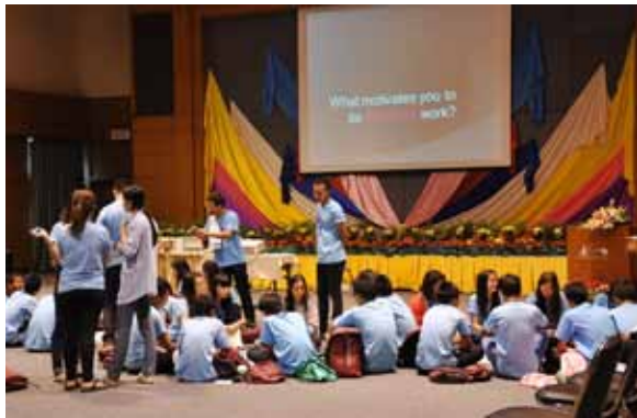
บรรยากาศในกิจกรรมระดมสมองเพื่อตอบคำถามที่ว่า “What motivates you to do volunteer work?”

ค่ายนี้ได้แบ่งเยาวชนออกเป็น 7 กลุ่ม กลุ่มละประมาณ 10 คน แต่ละกลุ่มตั้งชื่อตัวเอง ได้แก่ Sky, Rainbow, Blue Ocean, Dynamite, Tiger, The Awesome และ THE C 2 (เลข 2 เป็นตัวห้อย) แต่ละกลุ่มมีพี่เลี้ยงซึ่งเป็นนักศึกษาระดับมหาวิทยาลัยคอยอำนวยความสะดวก (จากการสอบถาม ได้ทราบว่าพี่เลี้ยงมาจาก ม.ธรรมศาสตร์และ ม.เชียงใหม่)