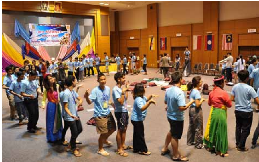
เยาวชนลาวเชิญชวนทุกคนให้ร่วมรำวง

เทคโนโลยีต่างชาติเข้ามา ก็ควรเลือกเฟ้นเฉพาะบางส่วนมาปรับใช้ให้เหมาะสม แต่เรื่องดีๆ ที่เป็นรากเหง้าของตนเองนั้น ก็อย่า (เฟล) ทำให้สูญหายไป พอพูดไปอย่างนี้แล้ว ก็นึกได้ว่าที่ว่าไปนั้นเป็นอุดมคติแบบสุดโต่งเอาการ ในขณะที่สังคมไทยกำลังทำสวนทางกับอุดมคติที่ว่ามานี้ อยู่หรือเปล่าหนอ?