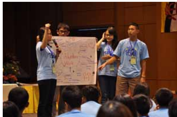
ลีลาการนำเสนอคำตอบของเยาวชนกลุ่มหนึ่ง

ในช่วงนำเสนอหน้าห้อง ผมพบว่านอกจากภาษาอังกฤษของพวกเขาจะยอดเยี่ยมแล้ว ความคิดก็ยังน่าชื่นชมอย่างมากอีกด้วย ลองมาดูตัวอย่างคำตอบกันว่าอะไรกันหนอที่ทำให้พวกเขาทำงานแบบจิตอาสา คำตอบแบบเรียบง่าย เช่น “อยากเห็นอะไรๆ ดีขึ้น” “อยากมีเพื่อนใหม่” “อยากเรียนรู้โดยการลงมือทำจริง” “อยากเห็นรอยยิ้มบนใบหน้าของคนทั่วโลก” และ “ต้องการให้คนอื่นรู้ว่าเวลาที่เป็นทุกข์ พวกเขาจะไม่อยู่อย่างโดดเดี่ยว แต่จะมีคนอยู่เคียงข้างคอยให้ความช่วยเหลือ” เป็นต้น