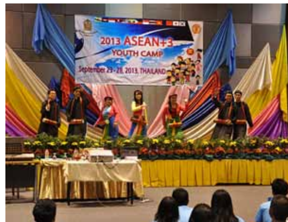
การแสดงดนตรีประกอบการเดินร่ำของเยาวชนเวียดนาม