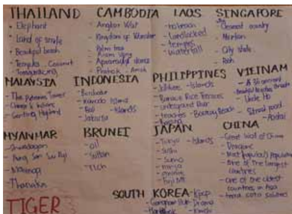
ภาพลักษณ์ของแต่ละประเทศในมุมมองของกลุ่ม Tiger

นั่นคือ มีโจทย์ให้แต่ละกลุ่มระบุสิ่งที่ตนเองนึกถึงเมื่อพูดถึงประเทศต่างๆ จากนั้นก็เขียนสรุปลงบนกระดาษแผ่นใหญ่ แล้วนำไปแปะที่ผนังห้อง