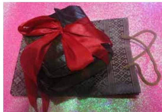
ของที่ระลึกจากทีมเวียดนาม : (ซ้าย) โบรชัวร์ประชาสัมพันธ์โรงเรียน ปกหน้า & บางส่วนของปกหลัง (ขวา) อาหารเวียดนามทำจากข้าวเหนียวห่อ & ใส่ถุงอย่างเรียบร้อย

เมื่ออุปกรณ์พร้อมแล้ว ยาวชนลาว 3 คน ก็เริ่มการแสดงอย่างสบายๆ ด้วยการเต้นบัตสลบ ต่อด้วยรำวง โดยยาวชนลาวได้เชิญชวนให้ทุกคนร่วมรำวงด้วยกันอย่างสนุกสนานครั้นเสร็จ จบกิจกรรมวันนี้ไปอย่างน่าประทับใจ