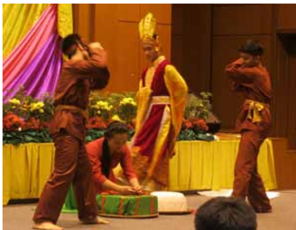
การแสดงละครนิทานพื้นบ้านของเวียดนาม

จากนั้นทีมเยาวชนเวียดนามก็เต้นประกอบเพลง โดยเริ่มจากเพลงเวียดนามสนุกๆ และปิดท้ายแบบเอาใจเจ้าภาพ นั่นคือ เต้นเพลงไอ้ละหนอ มายเลิฟ ของพีเบิร์ด “ฝากเอาไว้ก่อนนะ ขอทีวันนี้ไม่เอาละ เรื่องเราเอาคืนไว้ก่อนนะ วันพระไม่ได้มีคนเดียว...” เล่นเอาเราคนไทยอมยิ้มและปรบมือกันสนั่นทีเดียว!