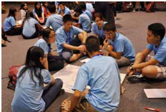
แสดงความคิดเห็น

ค่ายนี้ได้แบ่งเยาวชนออกเป็น 7 กลุ่ม กลุ่มละประมาณ 10 คน แต่ละกลุ่มตั้งชื่อตัวเอง ได้แก่ Sky, Rainbow, Blue Ocean, Dynamite, Tiger, The Awesome และ THE C 2 (เลข 2 เป็นตัวห้อย) แต่ละกลุ่มมีพี่เลี้ยงซึ่งเป็นนักศึกษาระดับมหาวิทยาลัยคอยอำนวยความสะดวก (จากการสอบถาม ได้ทราบว่าพี่เลี้ยงมาจาก ม.ธรรมศาสตร์และ ม.เชียงใหม่)