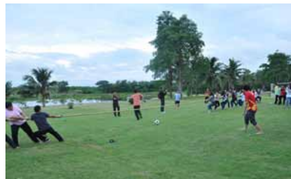
การแข่งขันชักเย่อ