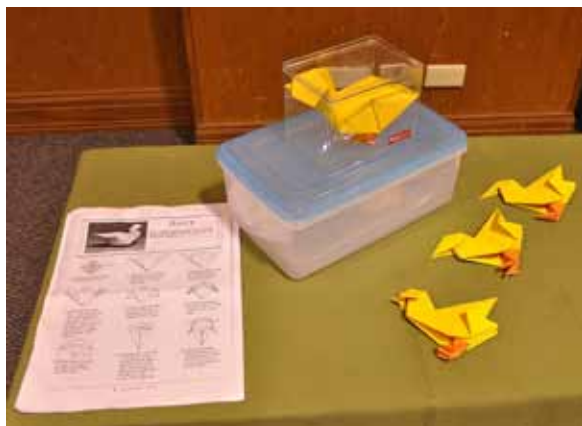
การแปลงกายของเบ็ดน้อย พร้อมแผนภาพและโมเดลแสดงขั้นตอน

คำตอบคือ ต้มยำกุ้ง (5 กลุ่ม) ช้าง (4 กลุ่ม) วัดวาอาราม (4 กลุ่ม) ในหลวง (3 กลุ่ม) มวยไทย (3 กลุ่ม) ตลาดน้ำ (3 กลุ่ม) ยัมสยาม (3 กลุ่ม) ภูเก็ต (3 กลุ่ม) พัทยา (2 กลุ่ม) ห้างสรรพสินค้า (2 กลุ่ม) ส่วนที่ตอบมาแบบกลุ่มเดียวได้แก่ ส้มตำ หาดทรายสวย ไหว้ ข้าว มะพร้าว ผัดไท สงกรานต์ กรุงเทพ เชียงใหม่ และ... มารีโอดี เมาร็อด (คำตอบสุดท้ายนี้มาได้ใจเอ๊ย อีอิ)