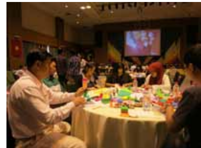
ครูจากประเทศต่างๆ ก็เข้าร่วมกิจกรรมพับกระดาษด้วย

ในแต่ละครั้งที่ผมจัดกิจกรรม ก็มักจะเจอลูกศิษย์คนโปรด 1-2 คน คำว่าลูกศิษย์คนโปรดของผมหมายถึง คนที่ตั้งใจมากๆ หรือมีบางอย่างที่โดดเด่น ในครั้งนี้ ผมมีลูกศิษย์คนโปรด 2 คน คนหนึ่งมาจาก กัมพูชา ส่วนอีกคนมาจากเวียดนาม